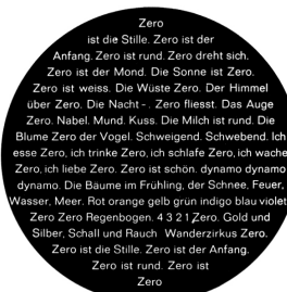
Zero der neue Idealismus

Termin- und Preisänderungen entnehmen Sie bitte der Presse und www.DRK-duesseldorf.de